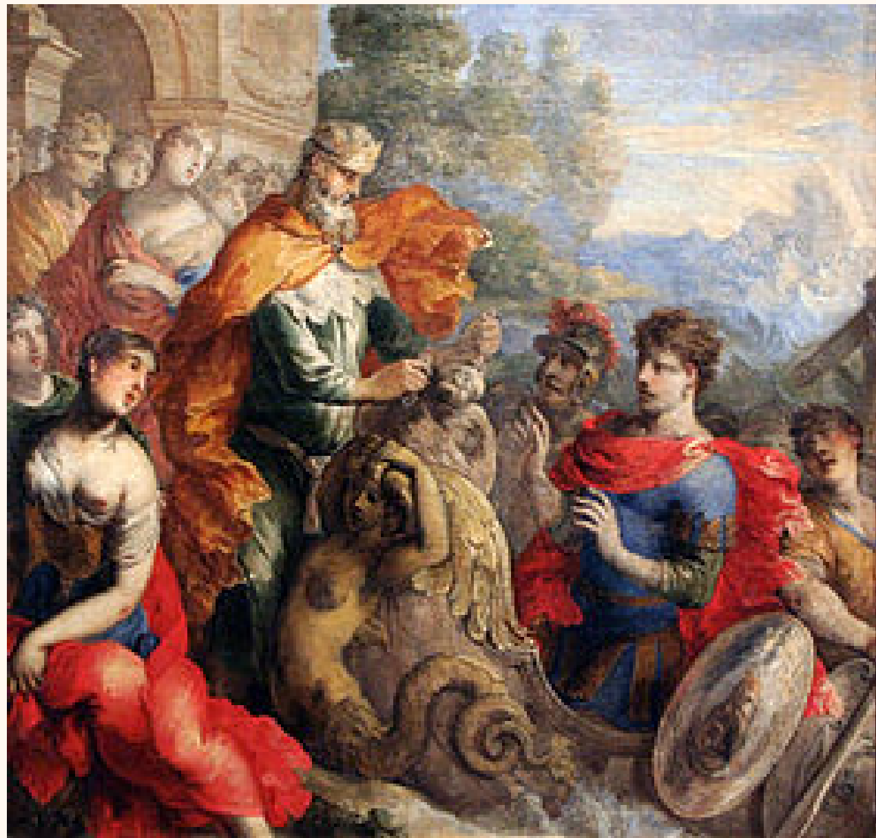
Isaac Moillon - Eolo entrega los vientos a Ulises

Según la Odisea, este Eolo, Señor de los Vientos, vivía en la isla flotante de Eolia, con sus seis hijos y sus seis hijas, que se habían casado entre sí.