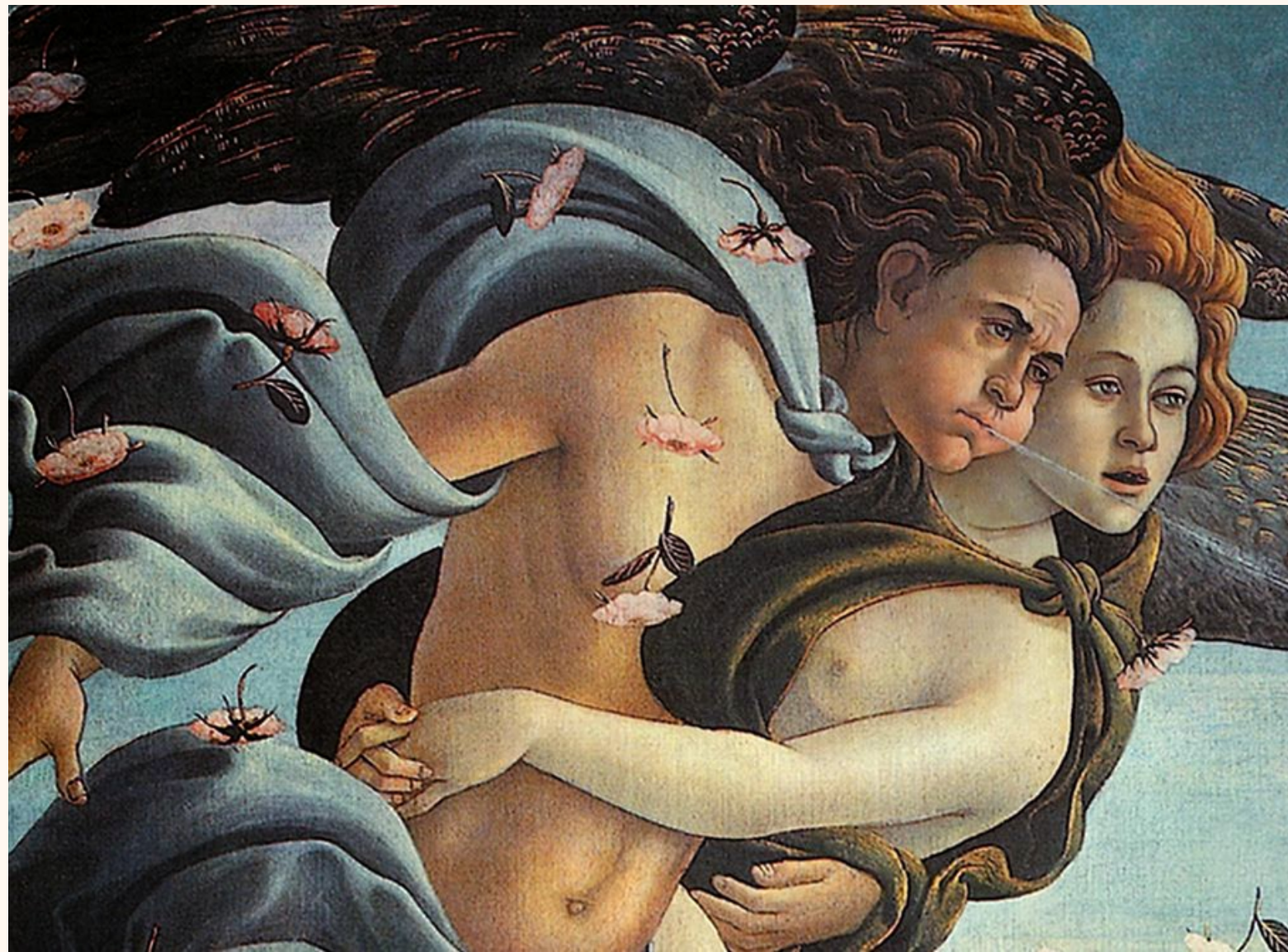
Sandro Botticelli - El nacimiento de Venus

Se le describe como rey de Eólida (posteriormente llamada Tesalia) y se le supone fundador de la rama eólica de la nación helénica.